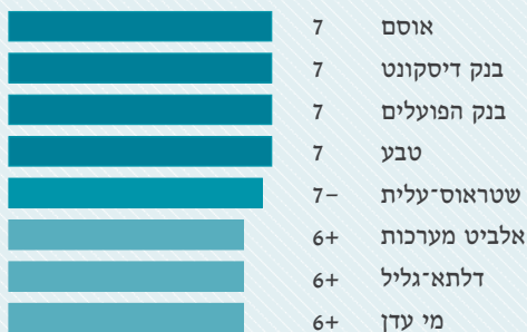
החברות המובילות בזכויות אדם וסביבת עבודה, 2006, דירוג מעלה