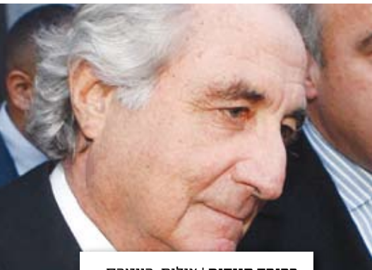
ברנרד מייזור

הישועה לא תבוא מפוליטיקאים המקבלים תרומות נדיבות, מפקידי ממשל העוברים לעבוד אצל מי שעליהם פיקחו; מעורכי דין המגינים על הפושעים האתיים. היא תבוא מרואי החשבון, שירימו את נס האתיקה ויובילו את החברה לדרך הישר. ●