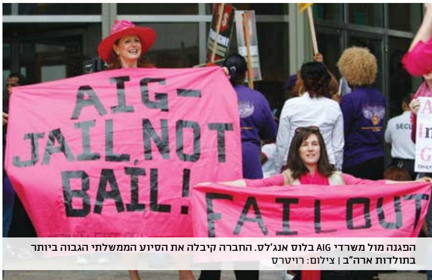
הפגנה מול משרדי AIG בלוס אנג'לס. החברה קיבלה את הסיוע הממשלתי הגבוה ביותר בתולדות ארה"ב